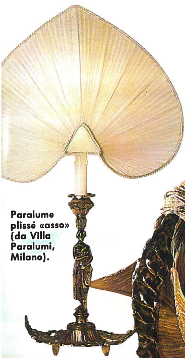
Paralume plissé «asso» (da Villa Paralumi, Milano).