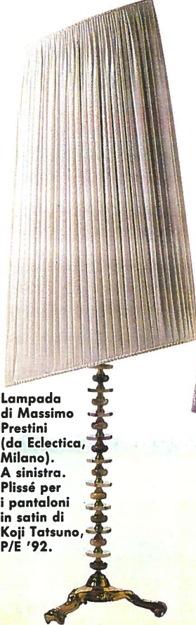
Lampada di Massimo Prestini (da Eclectica, Milano). A sinistra. Plissé per i pantaloni in satin di Koji Tatsuno, P/E '92.

trova in sofisticati interiors come quelli pensati dall'americano Reg Dohms e in oggetti di design come lo sgabello «Rococo» dell'inglese Gregory K. Tolaram. È anche punto di forza di accessori come quelli in seta a stampe Fortuny di «Venetia Studium», e naturalmente dei paralumi, importantissimi accessori d'arredo in cui la creatività gioca fra design e uso della luce: sono da ricordare quelli, classicissimi e sofisticati, creati su ordinazione dalle sorelle milanesi Villa, e quelli in carta di sapore orientale del designer Piero Urbano. Ma, ovviamente, il plissé rimane fondamentale tema-moda: ammiccante, invitante, flessuoso, sublimazione ideale dell'eterno femminile. Carlo Ducci