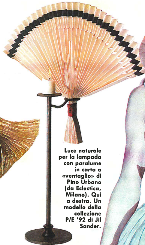
Luce naturale per la lampada con paralume in carta a «ventaglio» di Pino Urbano (da Eclectica, Milano). Qui a destra. Un modello della collezione P/E '92 di Jil Sander.